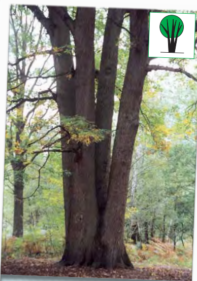
L'arbre en cépée